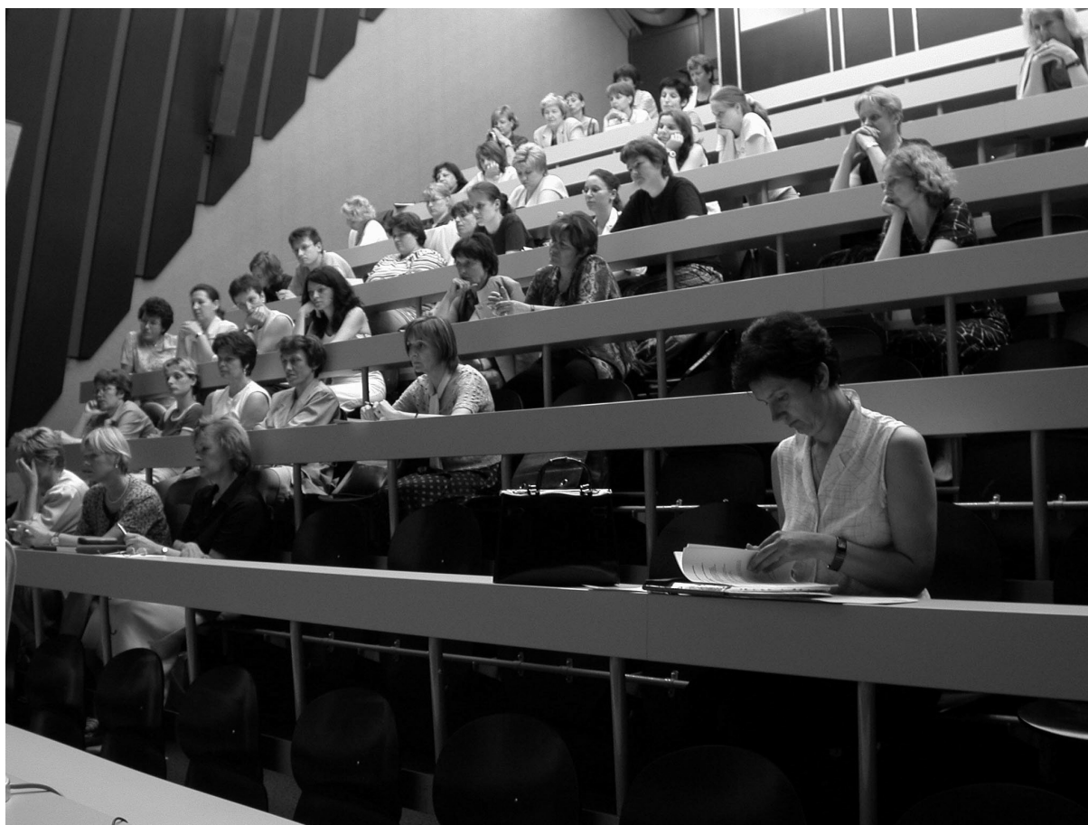
Slika 3 Zbrani na informativnem srečanju Sekcije za informatiko v zdravstveni negi – SIZ