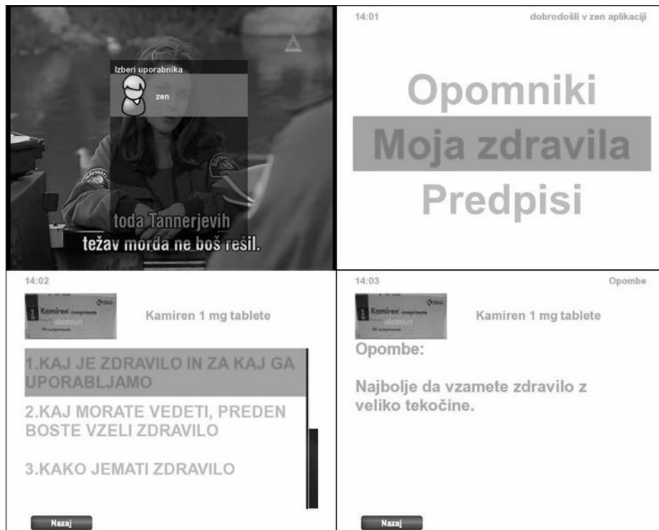
Slika 2 Primeri posnetkov zaslona uporabniškega vmesnika ZEN.