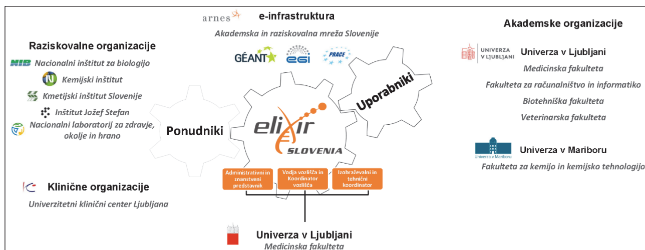
Slika 1 Člani slovenskega vozlišča ELIXIR-SI.

Slovenija sodeluje v mreži ELIXIR od leta 2016. Slovensko vozlišče ima sedež na Medicinski fakulteti Univerze v Ljubljani (UL; tam je Središče ELIXIR-SI na Inštitutu za biostatistiko in medicinsko informatiko – IBMI), v vozlišču pa sodelujejo še številne druge raziskovalne ustanove iz Ljubljane in Maribora (Biotehniška fakulteta UL, Fakulteta za računalništvo in informatiko UL, Veterinarska fakulteta UL, ARNES, Inštitut Jožef Stefan, Kmetijski inštitut, Nacionalni inštitut za biologijo, Nacionalni laboratorij za zdravje, okolje in hrano, Univerzitetni klinični center Ljubljana in Univerza v Mariboru – Fakulteta za kemijo in kemijsko tehnologijo; slika 1).