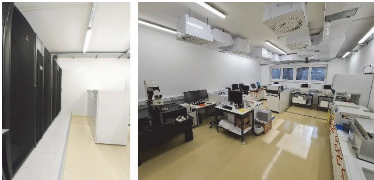
Slika 2 Del Središča ELIXIR-SI v Mariboru (levo del gruče ELIXIR-SI HPC, desno Laboratorij za sekvenciranje naslednje generacije).